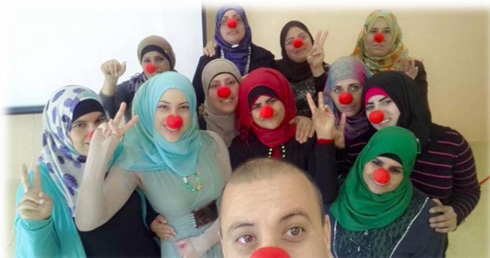
סיום קורס לאנשי צוות בנושא 'פנאי' לאנשים עם מוגבלות שכלית (תל שבע, 2015)

בבניית התוכנית, ישנו מיקוד באדפטציות תרבותיות ודתיות בהתאם לצרכים.